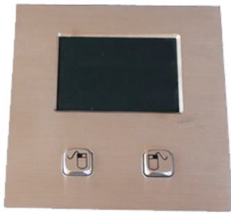
Art. 10021008 Art. 10021009