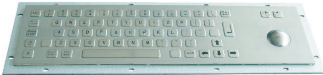
Abbildung US / Web-Layout, Seite 2: Beispiele DE und US Layout