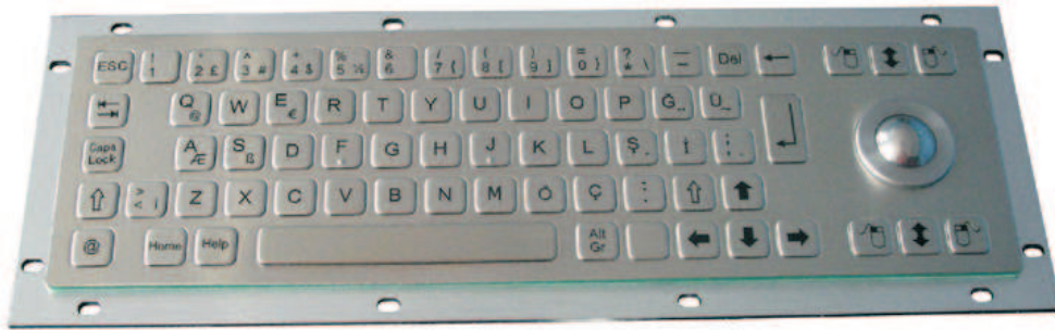
Abbildung US / Web-Layout, Seite 2: Abbildungen DE und US Layout