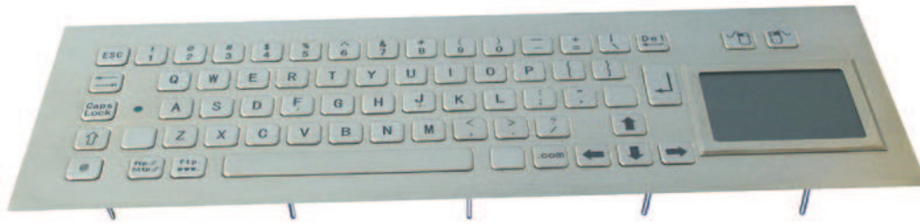
Abbildung US / Web-Layout, Seite 2: Abbildungen DE und US Layout