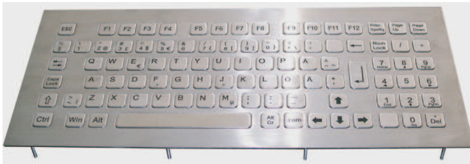
Abbildung US-Layout, Seite 2: Beispiel DE Layout