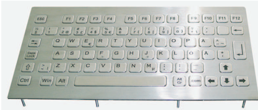
Abbildung US-Layout Seite 2: Beispiel DE-Layout