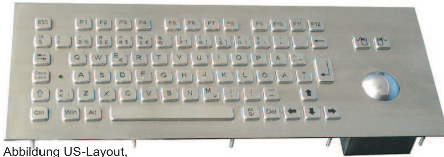
Abbildung US-Layout, Seite 2: Beispiele DE- Layout