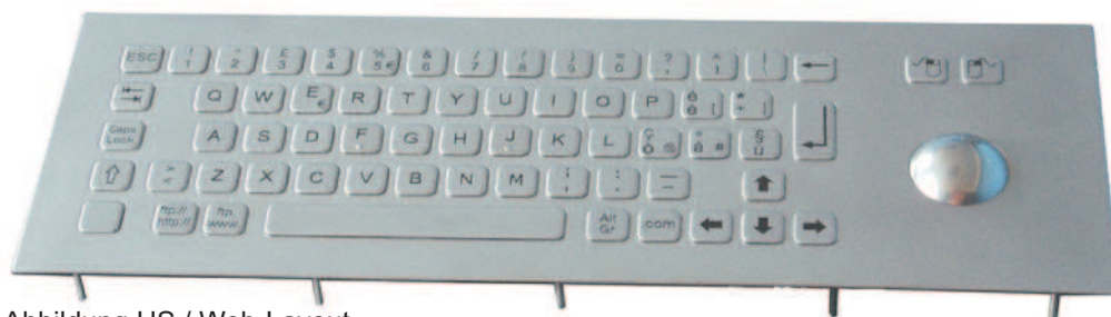
Abbildung US / Web-Layout, Seite 2: Abbildungen DE und US Layout