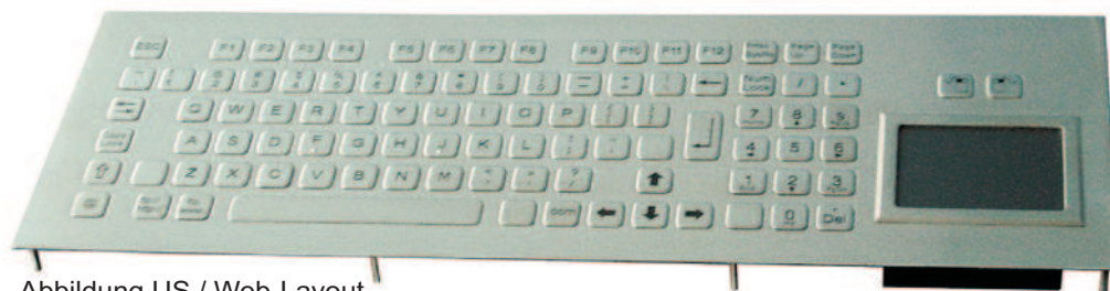
Abbildung US / Web-Layout, Seite 2: Abbildungen DE und US Layout