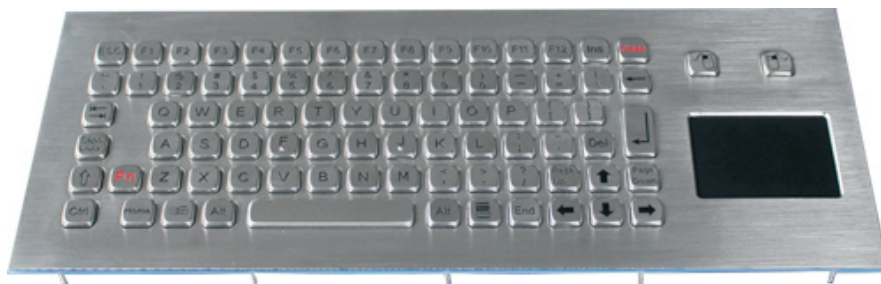
Abbildung US / Langhub, Seite 2: Abbildungen DE und US Layout