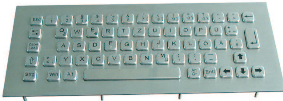
Abbildung: DE Layout Seite 2: US und US / Web Layout