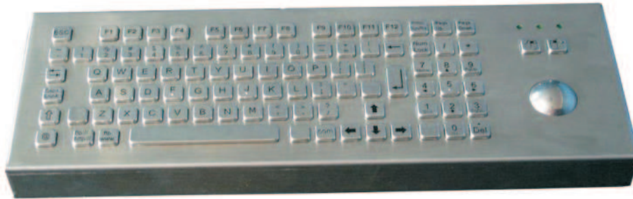
Abbildung US / Web-Layout, Seite 2: Abbildungen DE und US Layout