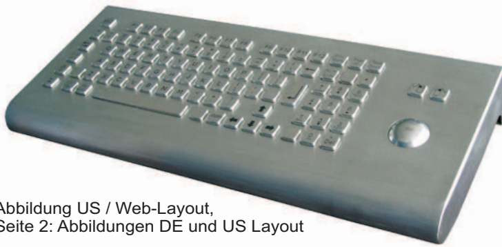
Abbildung US / Web-Layout, Seite 2: Abbildungen DE und US Layout