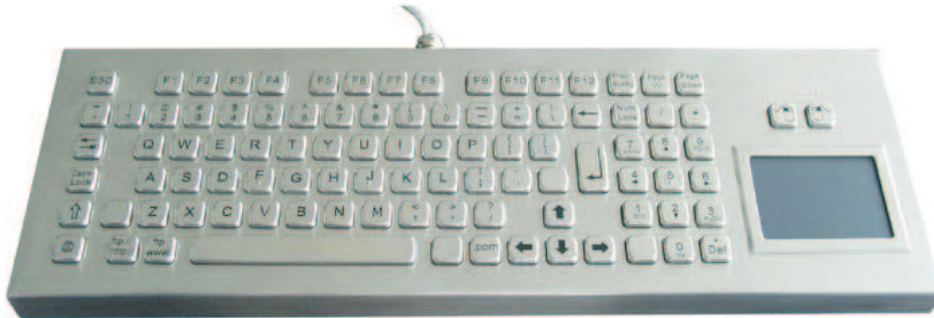
Abbildung US / Web-Layout, Seite 2: Abbildungen DE und US Layout