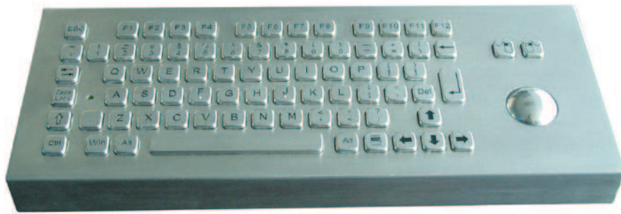
Abbildung US-Layout, Seite 2: Beispiel DE Layout