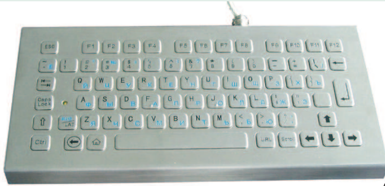
Abbildung Kasachisch-Layout, Seite 2: Beispiele DE und US Layout